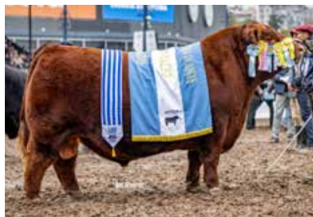
PADRINO, propio hermano.