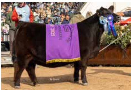
478 , Reservada Campeón Ternera Palermo 2025.

COSENZA DON ROBERTO 338 T/E FIGARI 406 JINETA-FIV- FIGARI 334 JINETA T/E