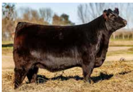
FIESTA , la donante N°1 de la nueva generación, hermana de estos embriones.

STRATUM 1333 CREDITO DISCOVERY-T/ ANQUOR 788 PATAGONIA-T/E- MERCACHIFLE LA CUBANA 004/7376-T/