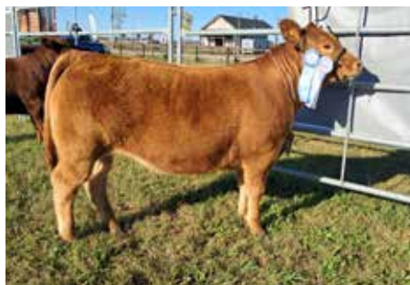
La Campeón Ternera Menor en Cañuelas 2025, su hermana.