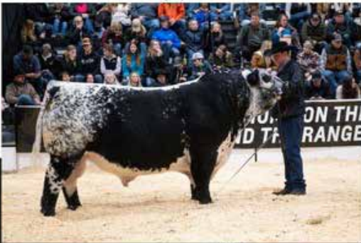
Notta Prime Time 312H

El toro fundador de la raza Speckle Park en Argentina. Impresionante por donde se lo mire, moderado, ancho, clasado y profundo