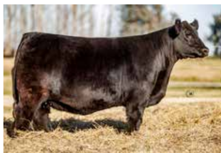
MÚSICA , imponente hermana de estos embriones.