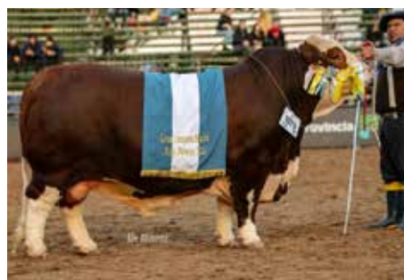
PEHUAJÓ , Bi Gran Campeón Macho Palermo y Nacional, hijo de su propia hermana.