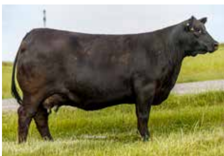
128, su gran madre.