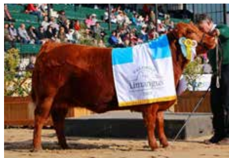
Su abuela paterna.