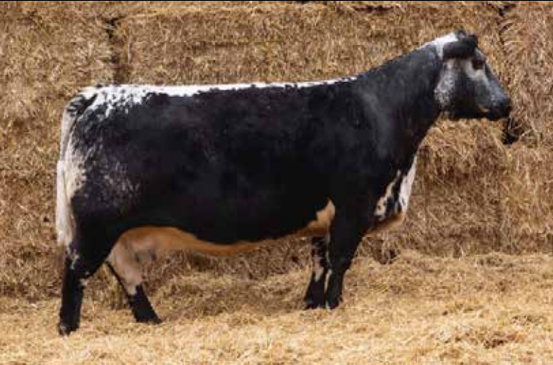
SPOTS'N SPROUTS 18X

Gran oportunidad de acceder a embriones de la prestigiosa Spots'n Sprouts 18X con el muy buscado Hundred Proof 19H. Tremenda combinación genética con el agregado de ser embriones moët (convencionales) y sexados hembra, atención!