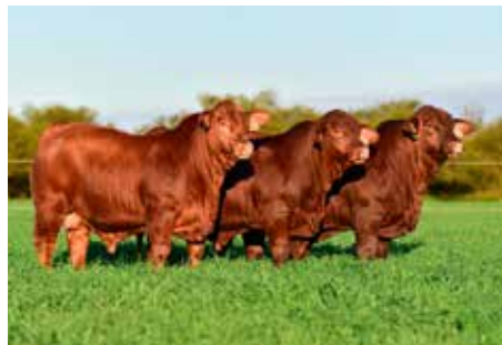
Lote Gran Campeón Ternero Conjunto. Expo Nacional Brangus 2025. Hijos de Mundial.