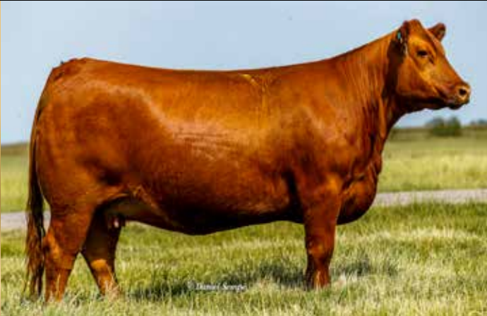
TRES MARIÁS A118 YESQUERO 8148

Atención, uno de los combos de embriones colorados más importantes que hayamos ofrecido! Tremenda oportunidad de incorporar la genética de dos verdaderos vacones, nada menos que las madres de los precios máximos "Record" (El Cortijo, Select Debernardi y Benjamín) precio máximo remate Selecta 2025 (vende Semex). La A118 es sin duda, una de las grandes vacas coloradas de la raza, hija de "Lilita", nieta de "Pantera" y con todo el respaldo de la familia de Zorzal, la 4850 y Patagonia, madre nada más que de Record. La A132, es un vacón cuya madre es hija de la gran 5854, madre de las 6700, madre de Quebrantador y Supremo, de la 98, madre de Vicky, Gran Campeona de Palermo entre otros. A esto súmele el exclusivo y muy buscado Red Box. Imperdible oportunidad!