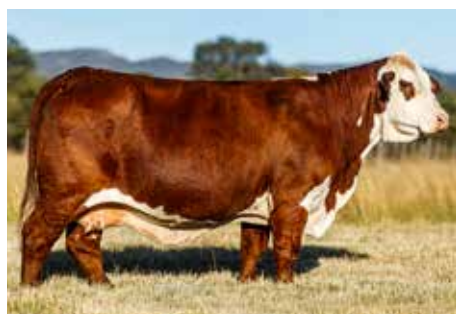
551, su madre.