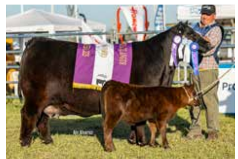
CARMELA , su propia hermana Reservada Gran Campeona Nacional 2025.