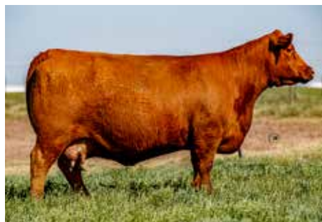
712 , su tremenda madre.