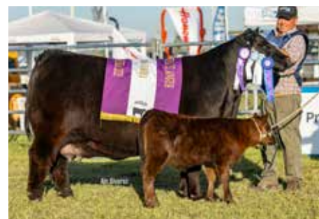
CARMELA , su propia hermana Reservada Gran Campeona Nacional 2025.