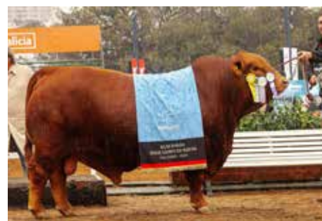
MAFIOSO , el toro record de la historia de la raza.