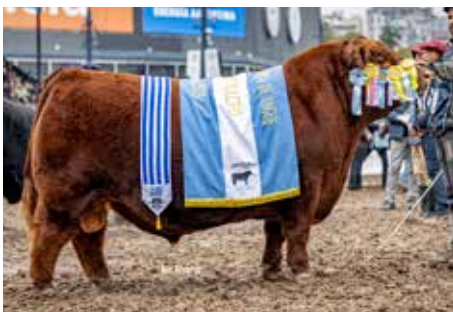
PADRINO , Bi Gran Campeón de Palermo y Otoño.