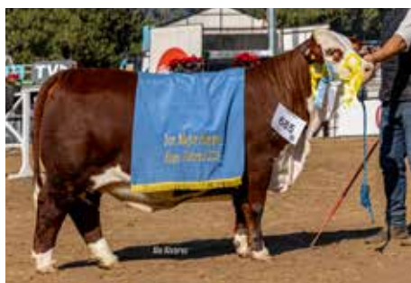
MAGIA, 3er. Mejo Hembra Palermo 2025.