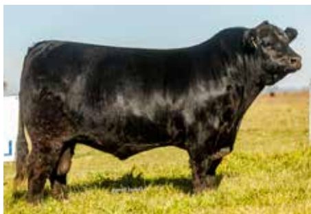
SURANGUS ESPECIAL , su muy buscado padre.