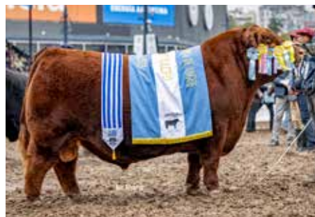
PADRINO , Bi Gran Campeón de Palermo y Otoño.