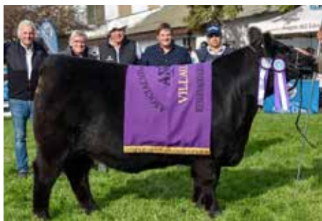
Su propia hermana, Reservada Gran Campeona.