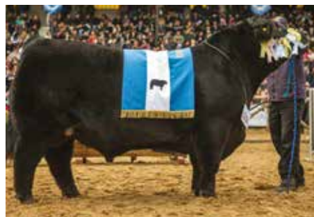
FEDERAL , Bi Gran Campeón de Palermo.