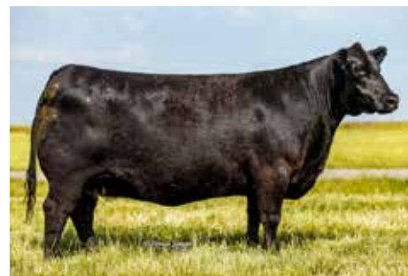
0421 , su gran abuela.