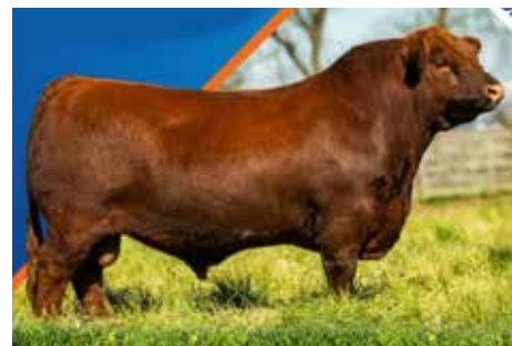
PODEROSO , su hermano precio máximo, hoy padre muy buscado en CIALE.