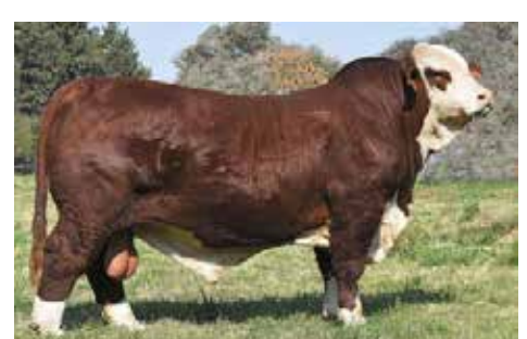
MAGO , muy buscado y de gran producción.