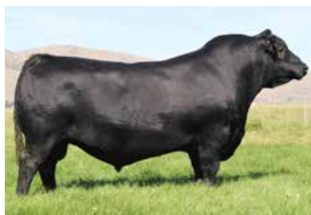
COLEMAN BRAVO, su padre, el gran productor de grandes campeones.