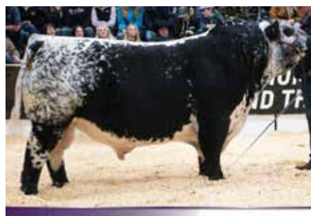
NOTTA PRIME TIME , Gran Campeón de Canadá y del Mundo, padre de la Gran Campeona, Reservada Gran Campeona y 3er. Mejor Hembra Palermo 2025.