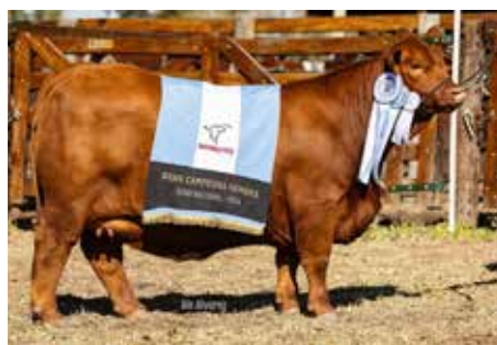
LA FORTUNA , su madre Gran Campeona Hembra de la Nacional 2024.