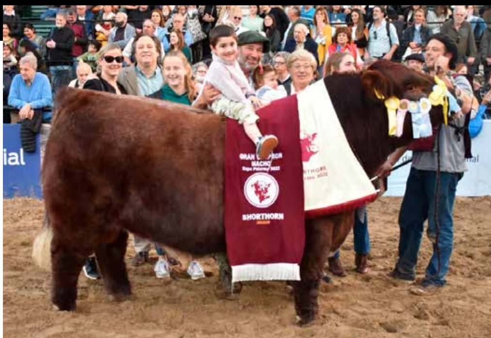
GRAN CAMPEÓN MACHO PALERMO 2022.