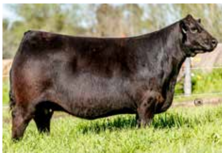
TIZIANA como donante, hoy con 8 años de edad.