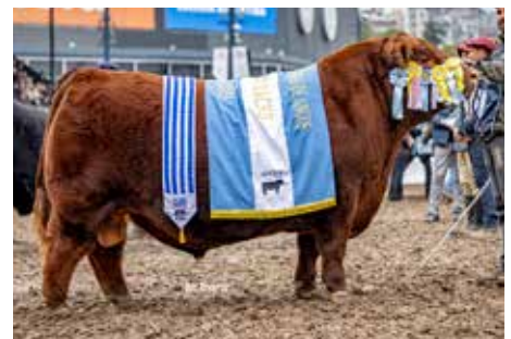
PADRINO , Bi Gran Campeón de Otoño y Palermo.