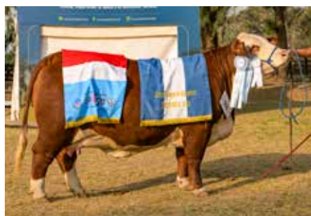
YARARA, Expo Mercedes.