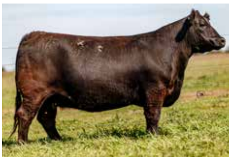
1169 , su muy consistente madre.