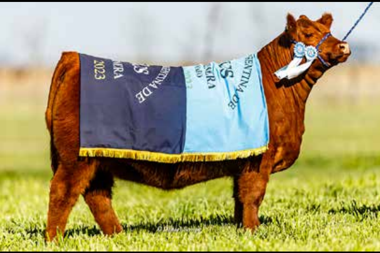
EFICACIA , Bi Gran Campeona de Palermo y Otoño Colorada.