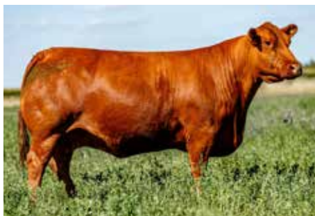
1981, su muy productiva y consistente madre.