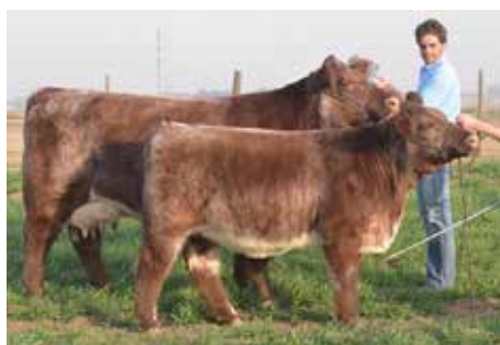
AFRODITA, su madre.