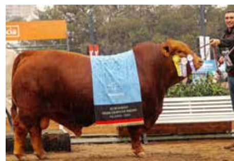
MAFIOSO , padre de los embriones.