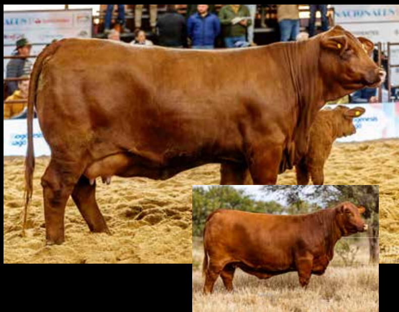
GALANA, madre de Dama.

A- 4 emb. congelados (garantía de 2 preñeces) de GIGÍ x MAFIOSO B- 5 emb. congelados (garantía de 2 preñeces) de DAMA x MAFIOSO