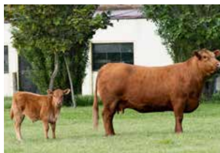
Su hijo al pie es Maslacq Chocolate RP 785, que tiene abuelo Melchor por padre y madre.