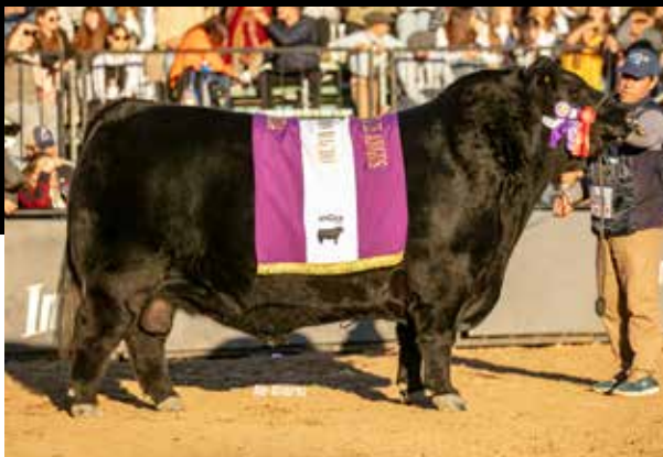
RESERVADO GRAN CAMPEÓN MACHO PALERMO 2024