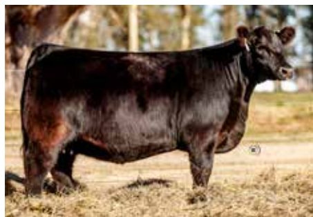
CLM 858 POESÍA , su propia hermana.