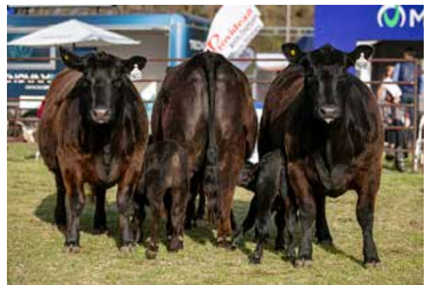
LOTE GRAN CAMPEÓN HEMBRA NACIONAL DE OTOÑO