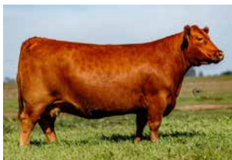
607, su madre, donante elite de gran producción.