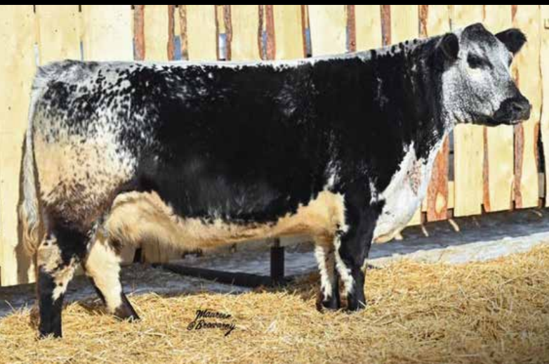
RAVWORTH WILLOW 134E

Willow no solo tiene mucha clase, físico carnicero, profundidad y ancho sino que es la propia hermana de la 510 H Gran Campeona de Agribition y del Mundo que lamentablemente murió. Como si fuera poco su propia hermana es nada menos que la madre de Coal Train, el toro N°1 de la raza en la actualidad. Tremenda oportunidad de acceder embriones de esta gran donante con el excepcional Colgans General, atención!