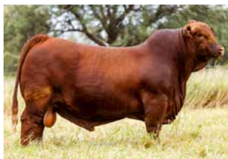
SORPRESA, su muy buscado y productivo padre.