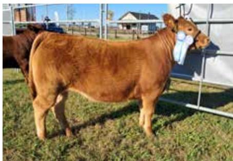
50, su hija, misma combinación que estos embriones.

CHIMPAY BENJAMIN 1286 CHIMPAY PATRONA 1897 CHIMPAY TORINO 939