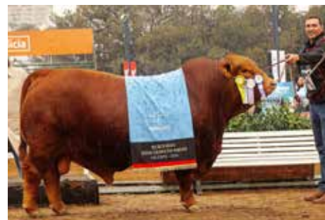
MAFIOSO , Reservado Gran Campeón Palermo 2024 y precio record de la historia de la raza.