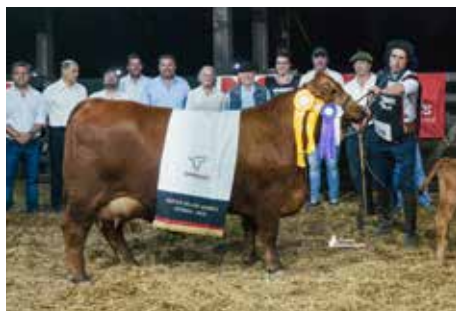
3er Mejor Hembra ExpoBra 2025.