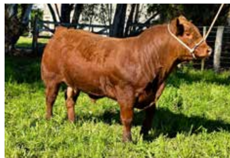
SANTINO , Reservado Campeón Ternero Mayor 2025.