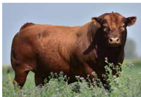
FIGARO, su padre.