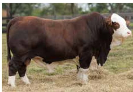
Hermano de estos embriones, cabeza de remate Los Orígenes 2025.