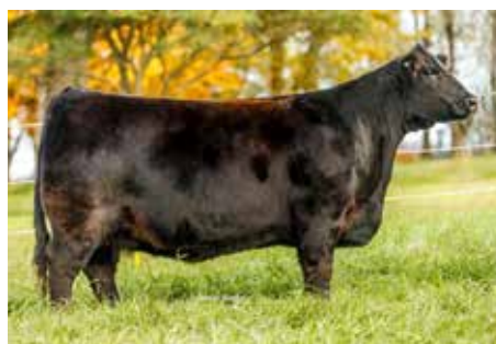
1294, su imponente abuela.