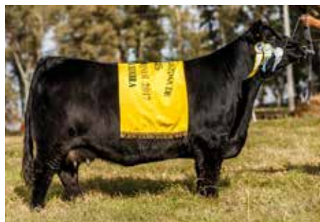
788 BONITA, su abuela de gran producción.