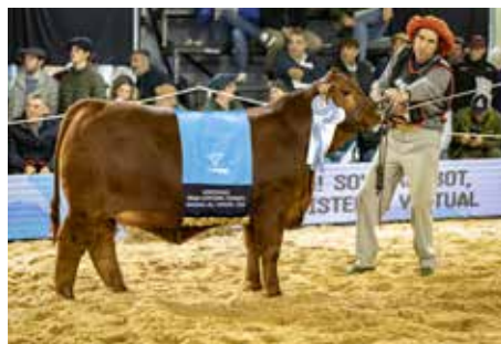
Rvda. Gran Campeon Nacional Ternero 2024.