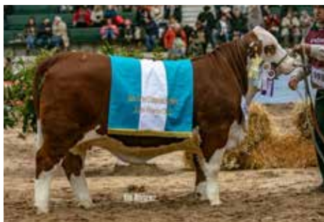
H0610, Gran Campeona.