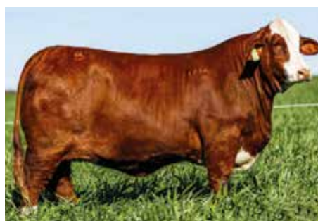
E300 , donante de los embriones.