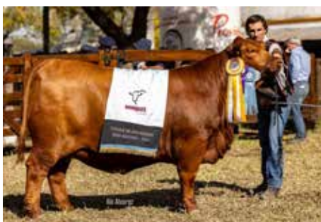
LA ILUSIÓN , Tercer Mejor Hembra de la Gran Nacional 2024, propia hermana.