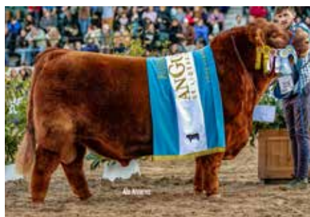
MATEO, Tri Gran Campeón, su padre.