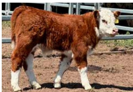
SOÑADO , espectacular hermano de estos embriones.