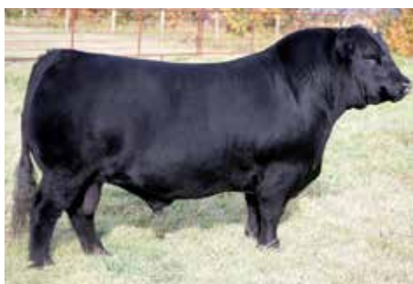
GREENWOOD COAL TRAIN , Bi Gran Campeón de Canadá, el padre número uno de la raza e hijo de su propia hermana.