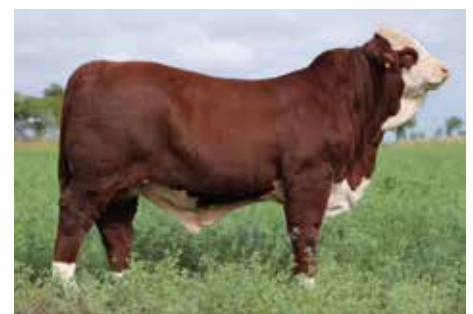
AMARGO 279F , Res. Gran Campeón Ind. a Corral Braford Avanza y Res. Gran Campeón Conjunto Nacional 2025.