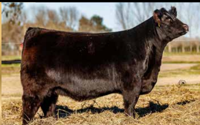
FIESTA , campeona vaca Palermo 2024 y de tremenda producción.

Nada menos que las famosas campeonas Fiesta, Mamma Mía y 0421 por el padre del momento Batacazo a su alcance! Sin duda tres pilares del programa genético padres campeones o madres campeonas e hijas de los grandes íconos Silvia, Bonita y 0421. Imperdible!