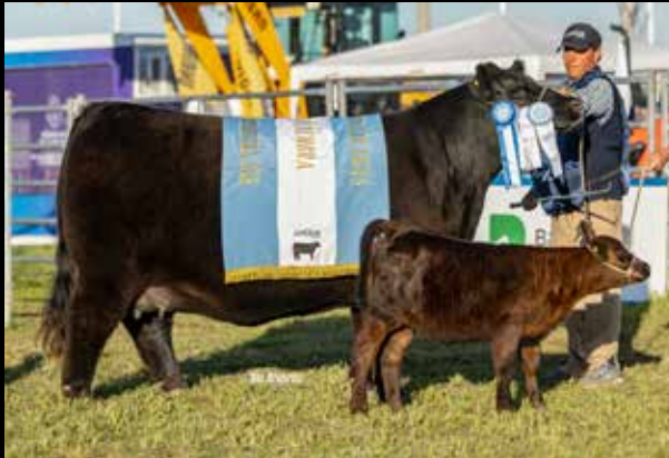
GRAN CAMPEÓN HEMBRA NACIONAL 2025.

Arandú ofrece una gran oportunidad, la elección del 50% de su mejor cría nacida en 2025. Compartamos un futuro de éxitos en las pistas y los programas de trabajo.