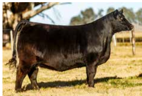
0570 , su gran madre, de tremenda producción.