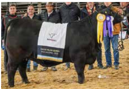
SOÑADA , en la Nacional 2024.