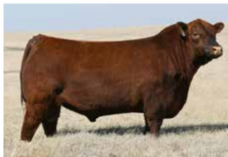
MANN RED BOX , el padre colorado del momento en el mundo.