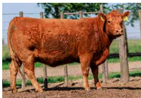
LUSAN INQUIETA, su madre.