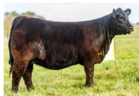
LA JUANITA 1032 SUPREMA, su hermana materna.