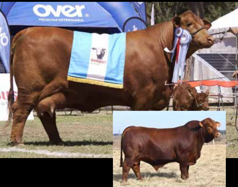
CAYMAN , su hijo con Ceyenne.

Joven donante con consistente producción. En su perfil de DEPs vemos un peso al nacer intermedio (68%), con destacado crecimiento (33% PD y 11% P18) y excelente AOB (1%).