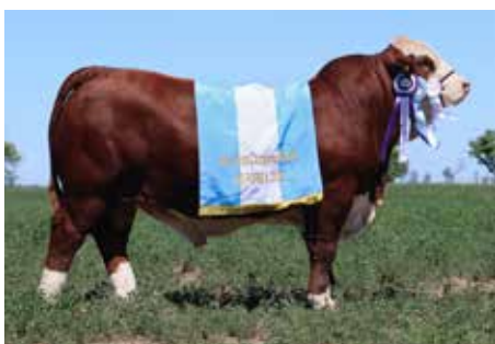
AMARGO ELEGANTE , Res. Gran Campeón Ind. a Corral Nacional Ternero, Res. Gran Campeón Conjunto Nac. Ternero y Res. Gran Campeón Macho ExpoBra 2025.