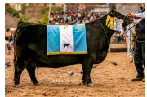
AMÉRICA , Gran Campeona de Palermo.