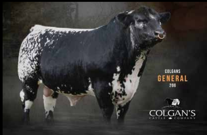
RAVWORTH WILLOW 134E

5 emb. congelados (moet convencional, garantía de 2 preñeces) de WILLOW 134E x COLGANS GENERAL