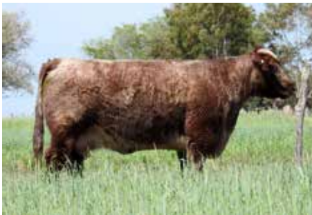
La Gran X477, fundadora de esta familia.

JSF TIMES SQUARE 120G ET DE LAND MARY TS M TAURO T/E" ROOSMO MARY 3 T/E