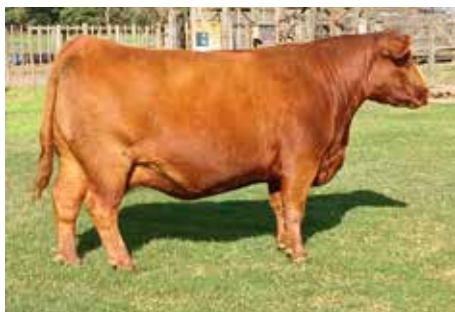
Abuela de Forastera.

EC CARLON 509 C-D-N C.D.N 56 PROLIJO 408 T/E RUMENCO 408 CACHAFAZ 180-T/E