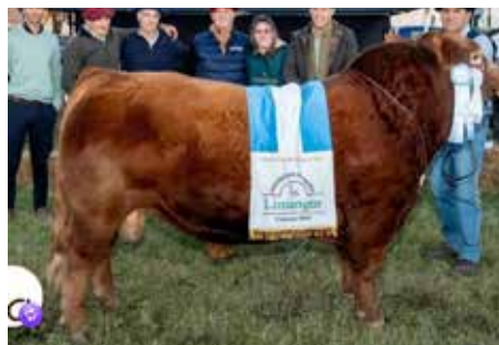
PERSEO, padre de estos embriones.