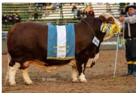
PEHUAJÓ , Bi Gran Campeón Macho de Palermo y Nacional, hermano de estos embriones.