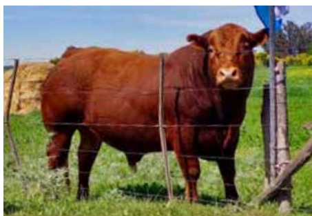
Padre de su preñez.