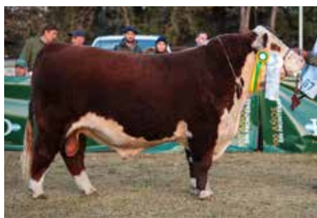
CICLÓN , su hermano.