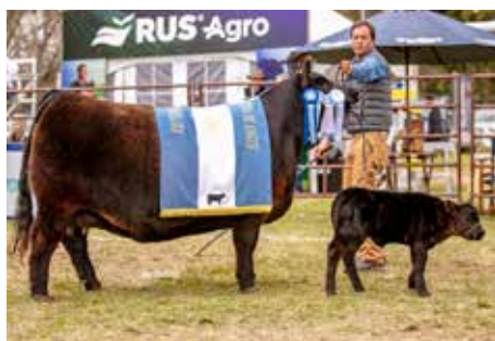
"MARTITA", su madre Gran Campeona Nacional 2023.