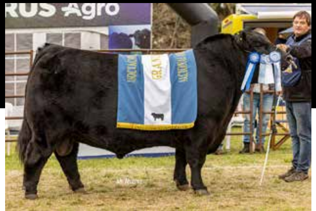
GRAN CAMPEÓN MACHO NACIONAL DE PRIMAVERA