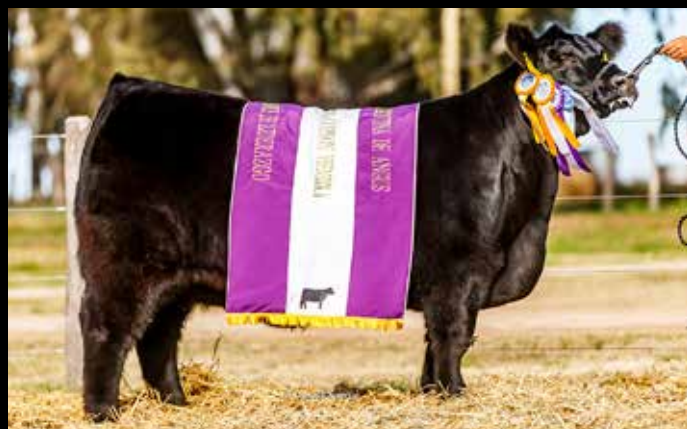
MAMMA MÍA , reservado gran campeón de otoño en Palermo 2023 y campeón en Palermo.