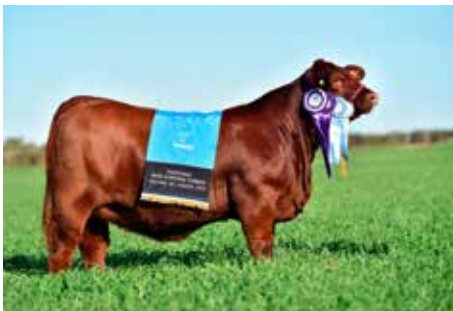
LUQUENSE 840 YVE A , Res. Gran Campeón Ternera - Expo Nacional Brangus 2025. Hija de Mundial.