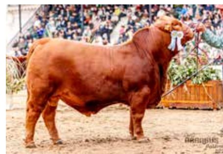
LUQUENSE 821 APOLO, su hermano entero.