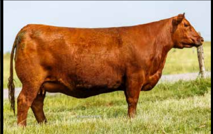
TRES MARIÁS A132 DAKTARI 8850