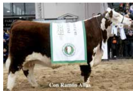
TRAVESÍA , su madre, Gran Campeona de Palermo.