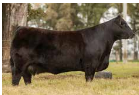
SILVIA , madre del año e ícono de la raza.