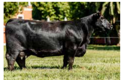
PATAGÓNICA 2204, gran donante.