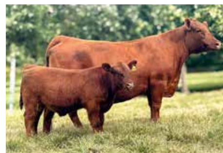
Con su última cría al pie.