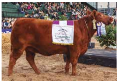
Reservada Gran Campeona Palermo 2022.