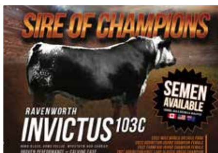
RAVWORTH INVICTUS , uno de los grandes toros de la raza y padre de múltiples grandes campeones, su padre.