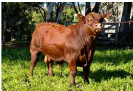
FRAN , Gran Campeón Ternero Mayor 2025.

CHIMPAY BENJAMIN 1286 CHIMPAY PATRON 1801 CHIMPAY TORINO 1239