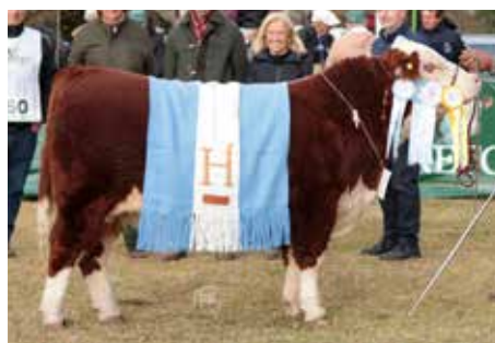
UNIVERSAL , Gran Campeón Ternero, hijo de Travesía.