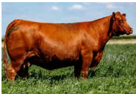
MAJESTUOSA, su madre.