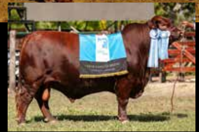
MUNDIAL, su padre.

5 emb. congelados (garantía de 2 preñeces) de A- hermanos de BERENICE B- MARGARET x MUNDIAL