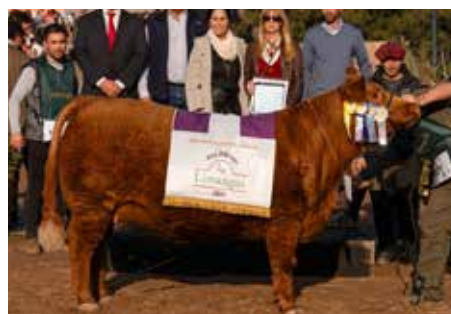
30, misma combinación que estos embriones.