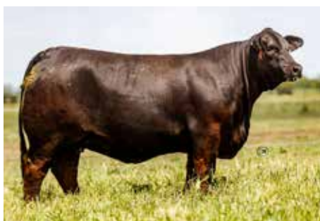
LA JUANITA 4 SOÑADA 302 T/E, su tremenda madre de gran producción.