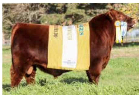
MICKY , Campeón junior Palermo y 2 veces Tercer Mejor Colorado de Otoño Indor

TRES MARIAS 8311 TRAPICHE-T/E- TRES MARIAS 8818 TRAPICHE 7932 TRES MARIAS 7932 HOLLY 7000-T/E-