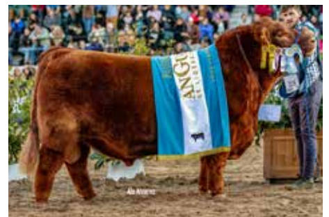
MATEO , Tri Gran Campeón, su padre.