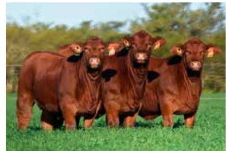
Campeón Ternera Mayor Conjunto - Expo Nacional Brangus 2025. Hijas de Mundial.