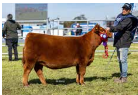
MAJESTAD , la primer hija de la Majestuosa, Reservada Campeona Nacional 2025.