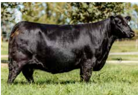
0174, su destacada madre, gran donante.