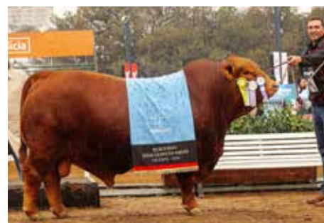
MAFIOSO , Reservado Gran Campeón Palermo 2024 y precio record de la historia de la raza.