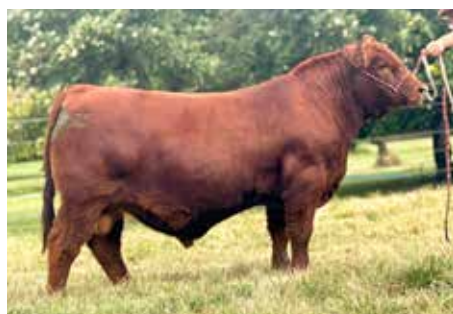
VISÓN , padre de cabaña x Precoz.