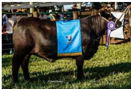
ITATÍ, Reservada Gran Campeón Ternera 2021.