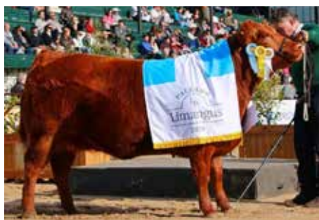
1981, Gran Campeona de Palermo.