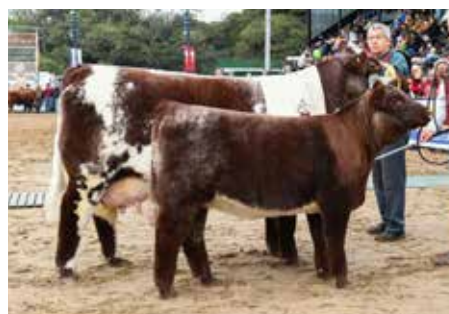
POTRANCA, su abuela.