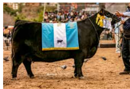
AMÉRICA , Gran Campeona de Palermo.