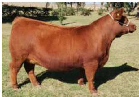
Madre de Forastera.