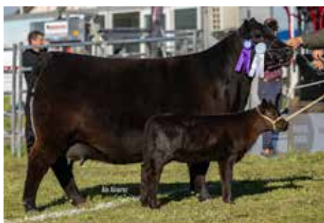
Su hermana la muy comentada Reservada Campeón Vaquillona Mayor Nacional 2025.