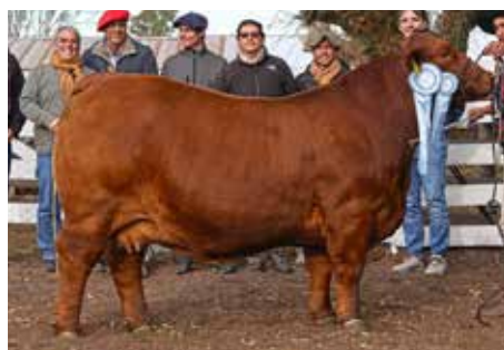
MORENITA , tremendo vacón, Campeón Vaca Nacional 2023 y Gran Campeona Brangus al Sur, propia hermana del lote B.