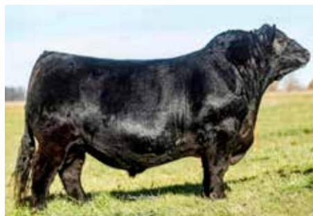
DON JOSÉ , Gran Campeón Ternero de Palermo, de tremenda producción.