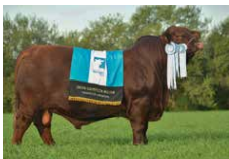
MUNDIAL , padre de los embriones.