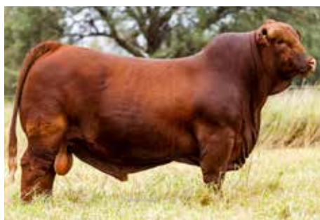
SORPRESA , el gran padre de la raza, hermanos de estos embriones.