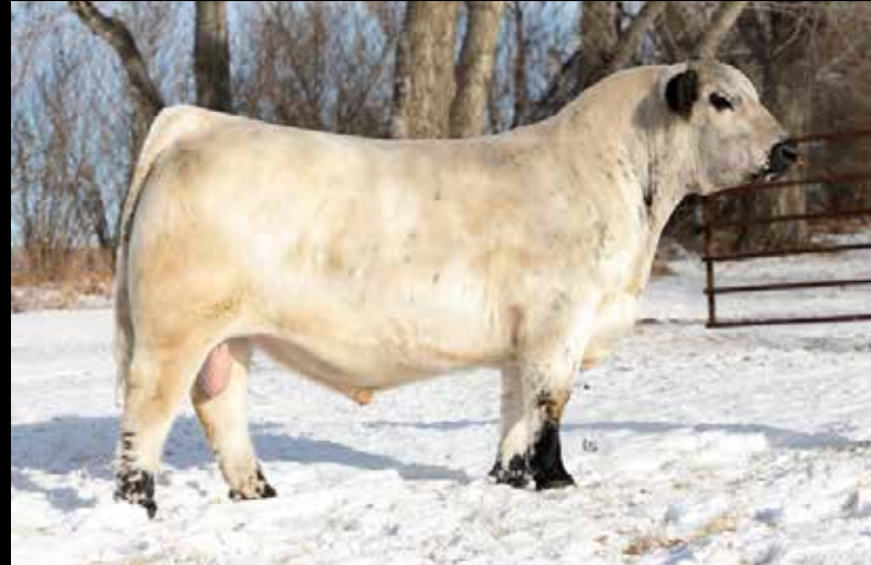
HUNDRED PROOF 19H

5 emb. congelados (sexado hembra, garantía de 2 preñeces) de SPOTS'N SPROUTS 18X x HOUNDREED PROOF 19H