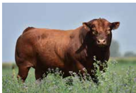
LUSAN FIGARO, su padre.