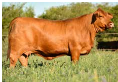
LUQUENSE 076 DAMA, su madre.