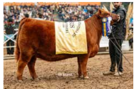
761 , propia hermana de estos embriones.