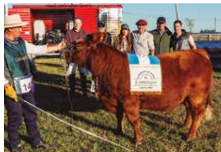
Reservada Campeona en Cañuelas 2025.