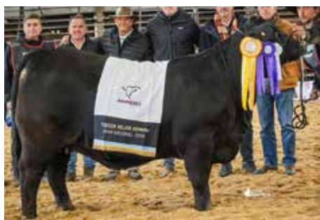
SOÑADA en la Nacional 2024.