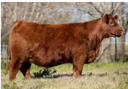
7746, su exitosa madre.