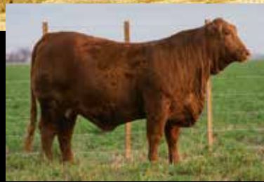
G416, su madre.