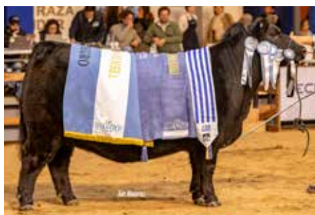
Gran Campeona de Otoño y Suprema Gran Campeona 2025, propia hermana de su madre.