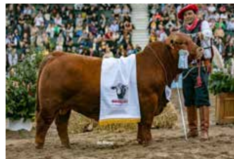
FACHERO , toro de gran producción, muy buscado.