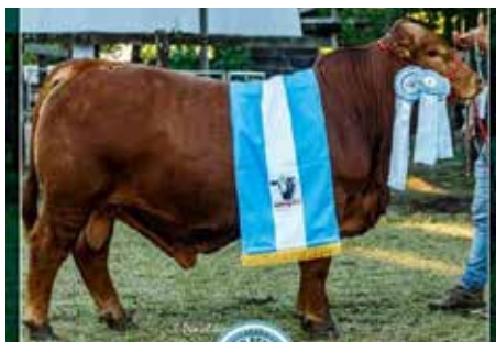
G486 TREMENDO , su padre.