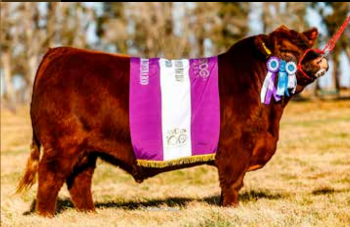
CLM 579 RECORD