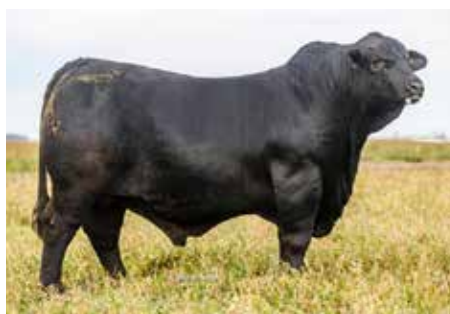
RESTAURADOR, el muy imponente padre de estos embriones.