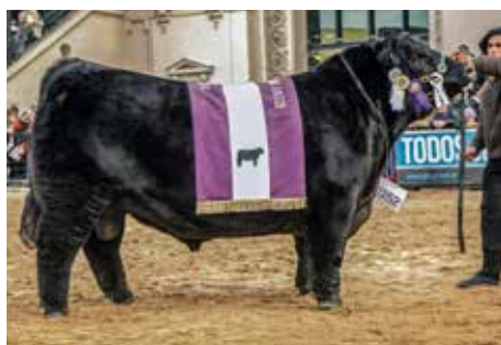
EURO , padre de la raza.