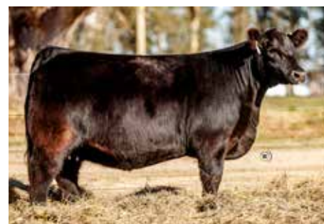
POESÍA , otra muy destacada hermana de estos embriones.