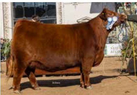
Campeón Vaquillona Intermedia Palermo 2025.

DON NESTOR 89 QUEBRANTADOR 24-T/E GUE-GLEN SUR SUR AIRELEN T/E GUE-GLEN SUR MAILIN