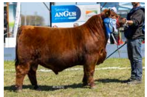
CHOMPI , Gran Campeón Ternero Colorado Nacional 2025, propio hermano.