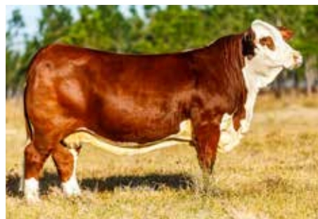
Su madre, Laguna Limpia H0352.