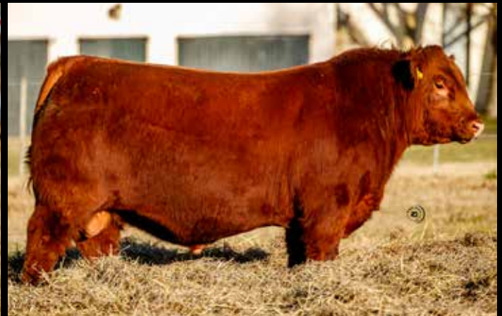
CLM 855 BENJAMIN

6 embriones congelados (garantía de 2 preñeces) de