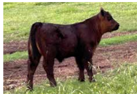
DJ , tremendo propio hermano de estos embriones. El mejor macho de la camada en Los Murmullos.