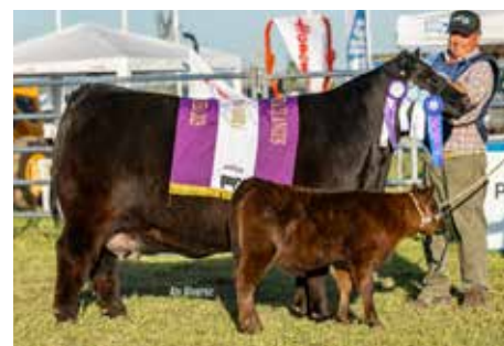
CARMELA , su propia hermana Reservada Gran Campeona Nacional 2025.