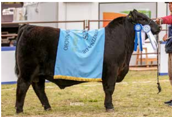
GRAN CAMPEÓN MACHO NACIONAL DEL TERNERO