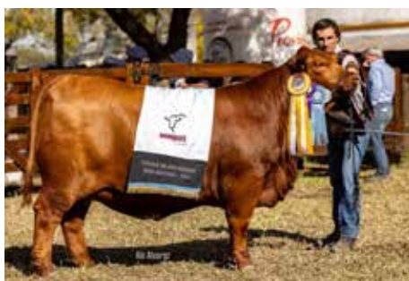
LA ILUSIÓN , Tercer Mejor Hembra de la Gran Nacional 2024, propia hermana.

SI869I DEL INFANTE PANCHO TORQUE 869 T/EI NANDO RINCON IBERA 656 NANDO 438 SORP FIV FORTIN RIFLES 438 SORP 9759 ROS FIV