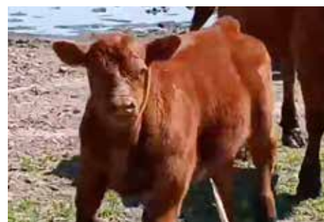
Imponente ternero hijo de La Majestuosa.