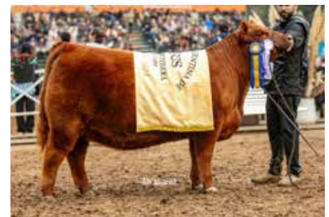
761, como Tercer Mejor Ternera Palermo 2024.