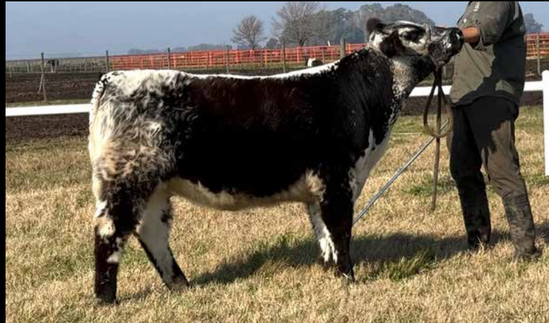
10 PARK UNIKE