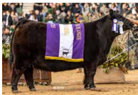
Reservada Gran Campeona de Palermo 2025.