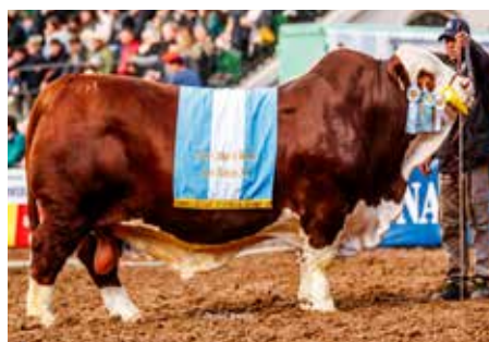
Gran Campeón Macho Palermo 2023, su padre.