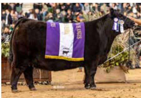
Reservada Gran Campeón Hembra Palermo 2025.