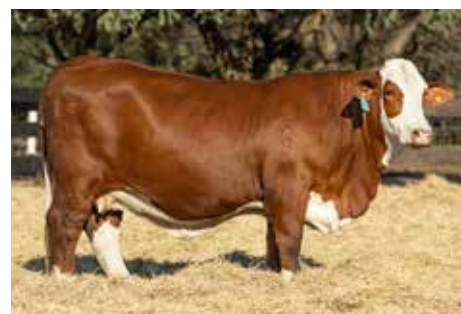
Otra hermana de estos embriones, cabeza de remate Los Orígenes 2024.