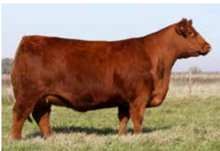
MULATA 6589 , su abuela y de Padrino, Bi Gran Campeón de Otoño y Palermo.