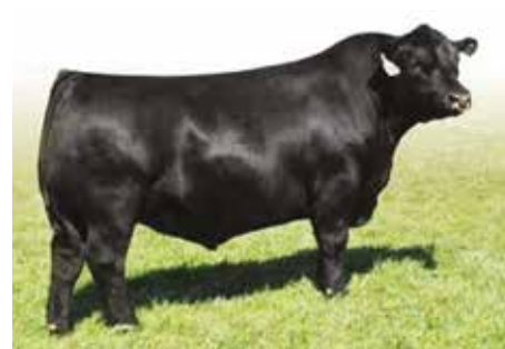
MR ANGUS , gran productividad.