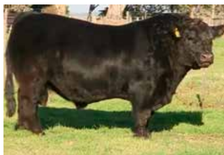
DON RAÚL , su muy buscado padre.