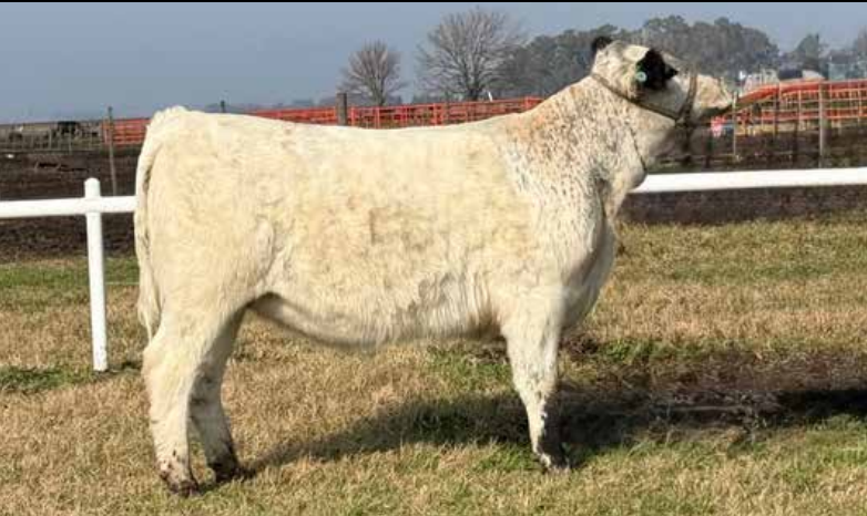
2 PRIMERA PARK

Estos embriones provienen del primer lavaje de Speckle Park hecho en Argentina. Incorpore la genética de Primera 4, y Unike 10 y Kat 6 con el toro número uno de la raza y Bi Gran Campeón Coal Train y Jesse, lotazo histórico!