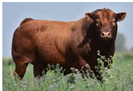
FÍGARO, su padre, padre de la raza.