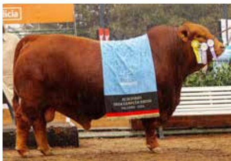
MAFIOSO , el padre record de la historia de la raza.