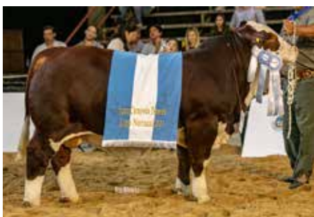
Gran Campeón Macho Nacional del Ternero Braford 2023, su hermano.