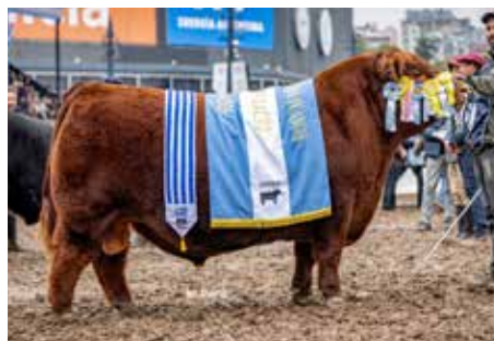
PADRINO , propio hermano de estos embriones.