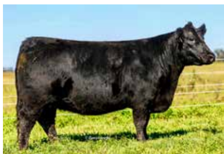
SOÑADA, su consagrada madre.

STRATUM 1333 CREDITO DISCOVERY-T/ LAFE 2358 VICKY CREDITO T/E LAFE 1294 VICKY DENSITY-T/E-