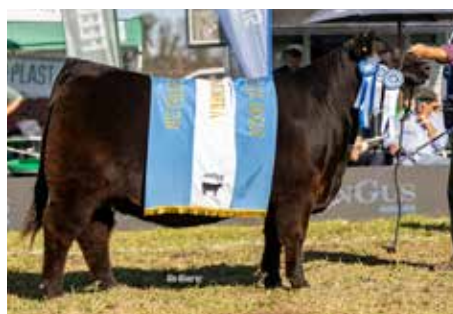
FRANCESCA, propia Gran Campeona Nacional 2024.