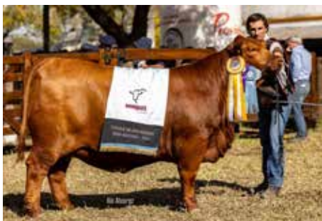
LA ILUSIÓN , Tercer Mejor Hembra de la Gran Nacional 2024, propia hermana.