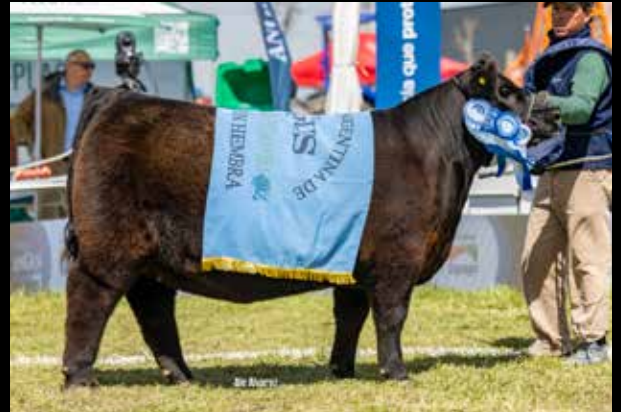
GRAN CAMPEÓN HEMBRA NACIONAL DEL TERNERO 2025.