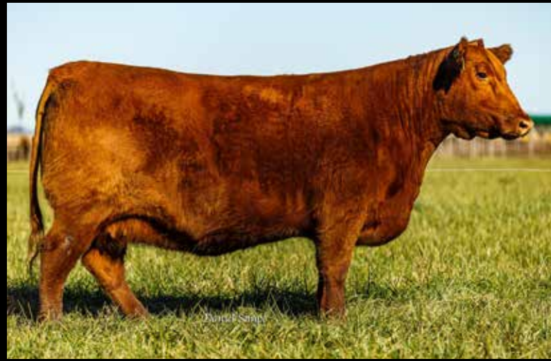
417 , su madre.

Elección de 5 embriones congelados (garantía de 2 preñeces) de a la carta de EFICACIA o 417