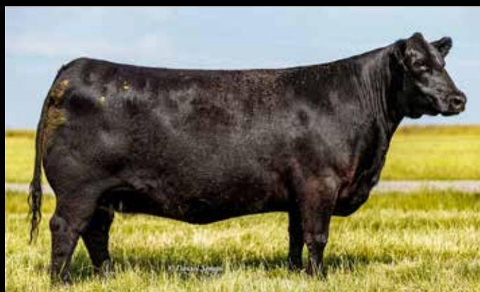
0421 , madre de grandes campeones de Palermo y nacional.

5 embriones congelados (garantía de 2 preñeces) de