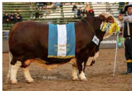
PEHUAJÓ , Bi Gran Campeón Macho Palermo y Nacional, su nieto.