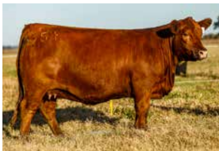
LA JUANITA 754 PODEROSA , su muy buscada madre, vacón!