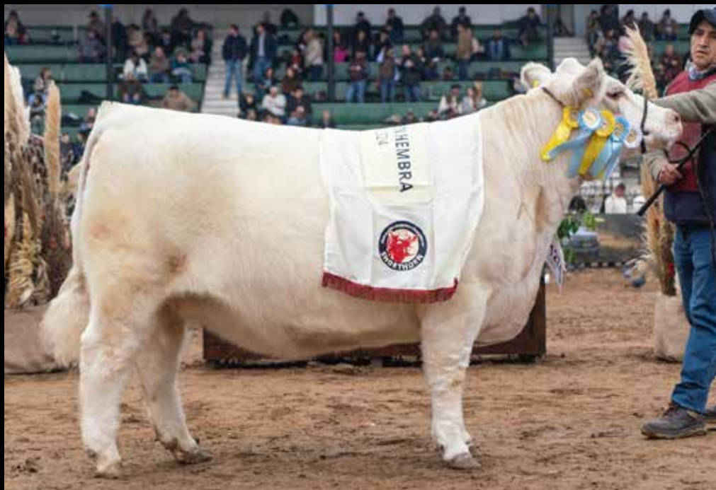
GRAN CAMPEÓN HEMBRA PALERMO 2024.

del/a mejor ternero/a sobre total de la parición 2025.